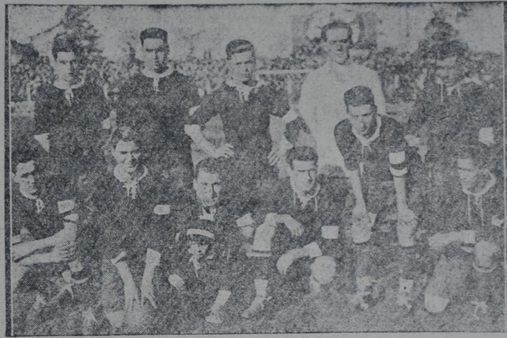
El cuadro de Independiente, campeón de la A. Amateurs y vencedor de los escoceses

Este nuevo tanto trajo sus consecuencias y varios jugadores del Independiente variaron que ser atendidos por